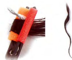
SF オレンジ(20mm) 9ヶ入 530円