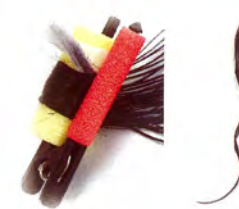
M イエロー(24mm) 9ヶ入 630円