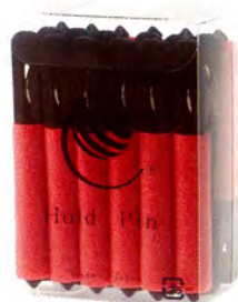
専用ホールドピン12本入 1,530円