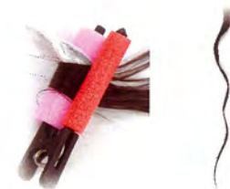
S ピンク(18mm) 9ヶ入 470円