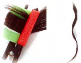
MF ライトグリーン(28mm) 9ヶ入 730円