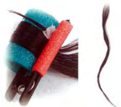
L グリーン(32mm) 9ヶ入 840円